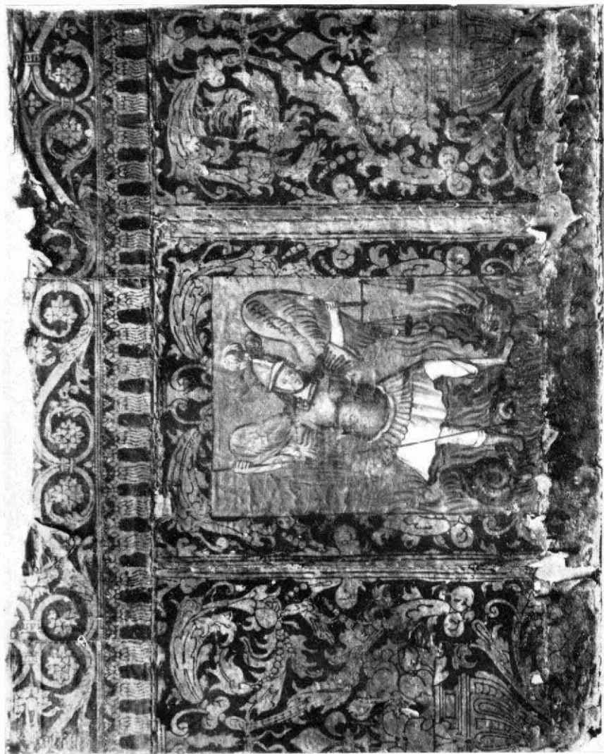
Museu Diocesà de Vic. Patrí de guadamassil. Segles XVI-XVII.