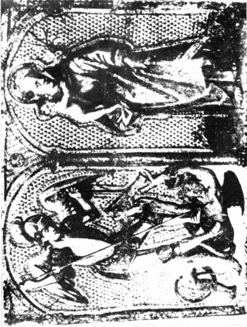
Museu de la Pell d'Igualada. Guadamassil amb les figures dels sants Miquel Arcàngel i Antoni de Pàdua, Segle XVI.