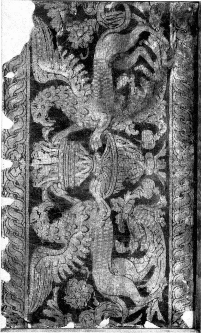
Museu Diocesà de Vic. Guadamassil, Segle XVII.